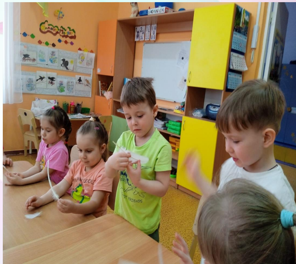
Опыт «Как устроены перья у птиц» (рассматривание перьев с помощью лупы и микроскопа)