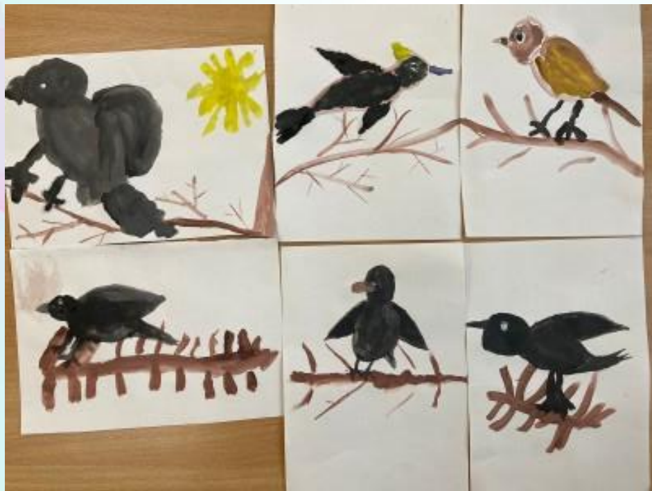
Рисование «Перелетные птицы нашего города»