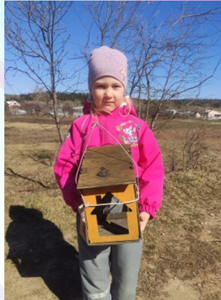
Экологическая акция «Кормушка»