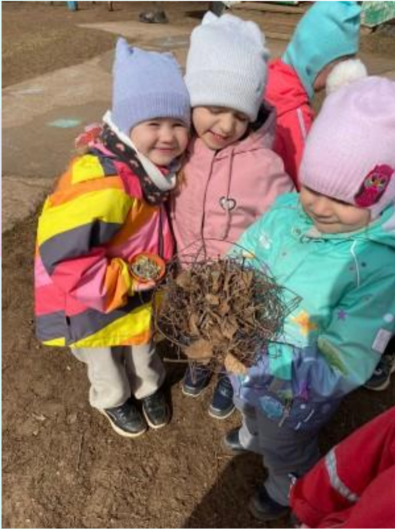
Проблемной ситуация « Почему у птиц такие крепкие гнезда? »