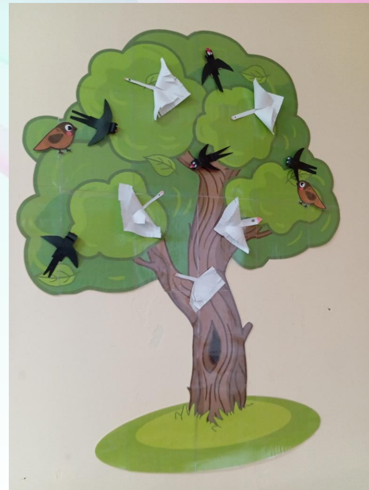
Конструирование из бумаги «Ласточка», «Лебедь»